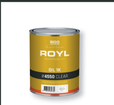
ROYL OIL 1K