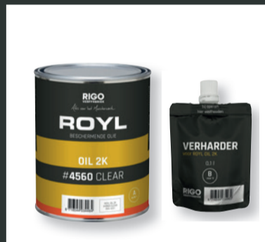
ROYL OIL 2K